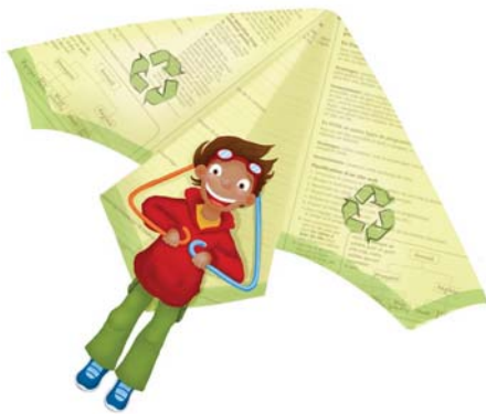
Illustration – Julie Deschênes

Notre nouveau défi technologique pour le primaire semble inspirer des professeurs et des conseillers pédagogiques! Non seulement ces derniers encouragent-ils les enseignants à mettre en œuvre le Défi apprenti génie en classe, mais ils rivalisent de créativité pour enrichir et développer le concept. En visitant le site du DAG , vous trouverez des informations complémentaires et des suggestions d'activités grandement pédagogiques, qui vous donneront du vent dans les voiles!